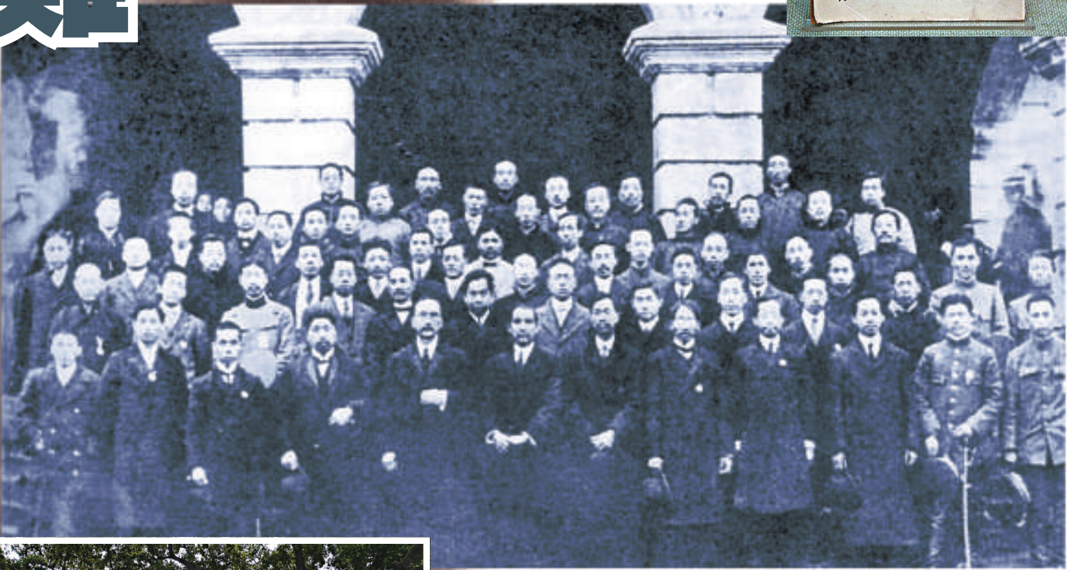
▼孫中山（中）在臨時參議院解除臨時大總統職務時留影