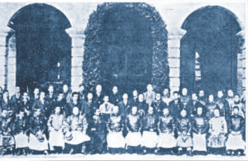
▲1911年12月29日，十七省代表會議代表合影

今天我們回頭審視近代中國的民主政治嘗試，只能嘆息：革命容易，建設難。一直到辛亥革命過去38年後，一個真正的人民當家、各族共和的現代國家，才在中國共產黨的領導下誕生，並以巍然不可戰勝的姿態，屹立於世界的東方。