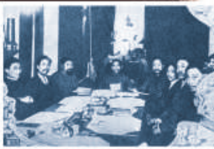
▲1912年1月3日，孫中山組成中華民國臨時政府。圖為孫中山（中坐者）在1月5日主持第一次政府會議

辛亥革命以後，孫中山仍然在民主革命的道路上艱苦前行，但無論是反對袁世凱的「二次革命」，還是反對段祺瑞的護法運動，都遭到失敗。在屢屢受挫之際，俄國十月革命的影響，五四運動的爆發，馬克思主義的傳播，以及中國共產黨的誕生，都對孫中山產生巨大影響。