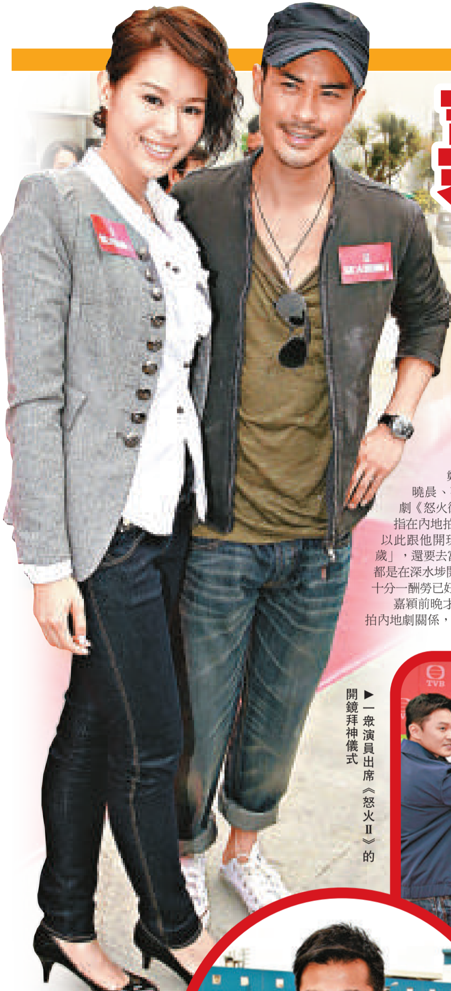
▲一眾演員出席《怒火II》的開鏡拜神儀式