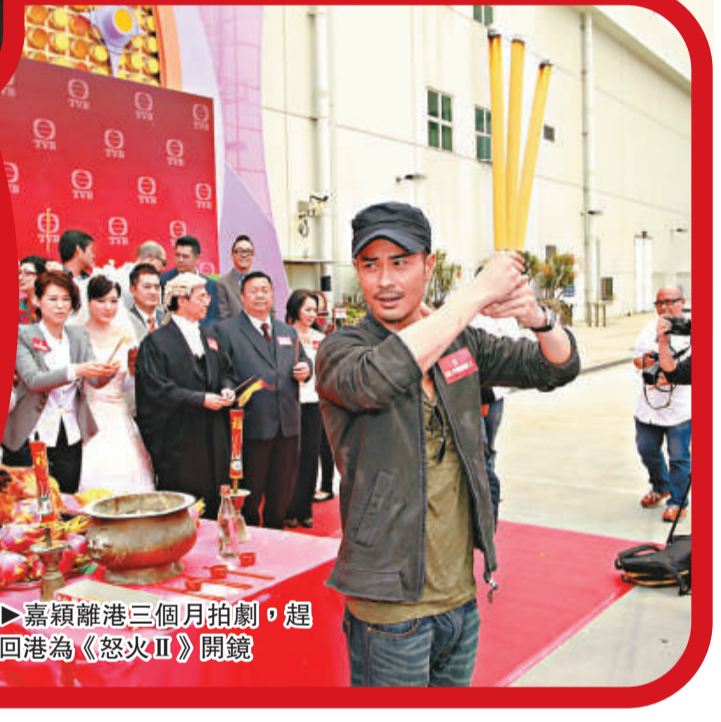
▲嘉穎離港三個月拍劇，趕回港為《怒火II》開鏡