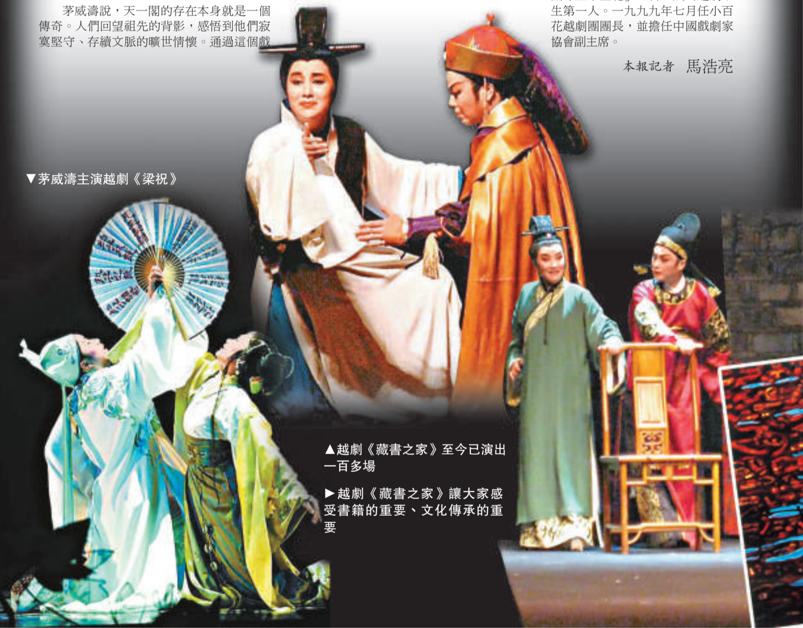
▲越劇《藏書之家》至今已演出一百多場