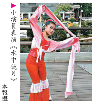
▲小演員表演《水中鏡月》