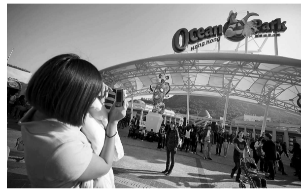
▲海洋公園希望新指引能改善事故發生時的對外溝通程序透明度 資料圖片

海洋公園主席盛智文表示，就近日事故花了不少時間檢討，以及改善對外溝通程序的透明度，最終決定採取更嚴謹事故通報指引，公園將不斷檢視事故通報機制。