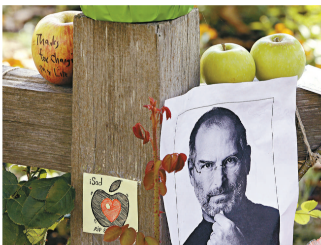
喬布斯的門外成為了喬布斯的悼念中心