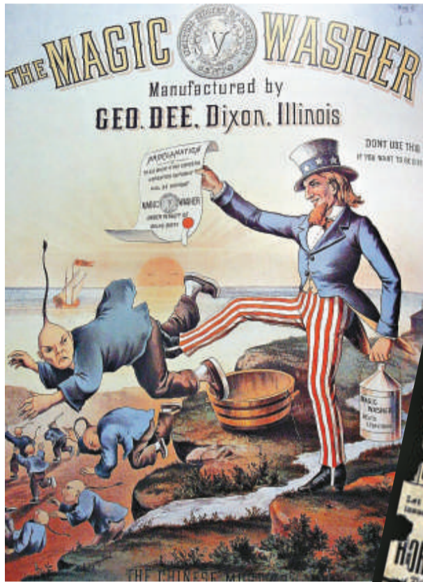
一張描繪美國人手持排華法案踢走中國人的海報

美國歷史上只有5次獲國會通過的道歉案：1988年美國政府就二戰時期將日裔美國人關進集中營進行道歉和賠償