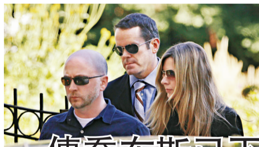
保安人員7日護送一女子離開喬布斯家中