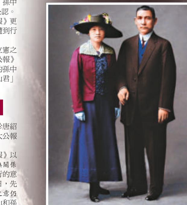
孫中山與宋慶齡婚後合影