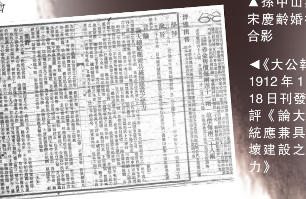
《大公報》1912年1月18日刊發社評《論大總統應兼具破壞建設之能力》