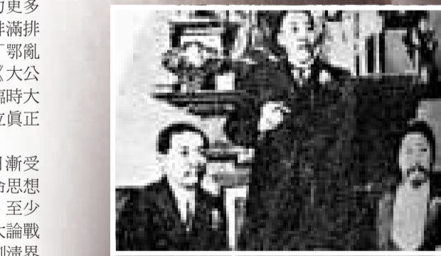
1905年孫中山（左）與黃興在東京