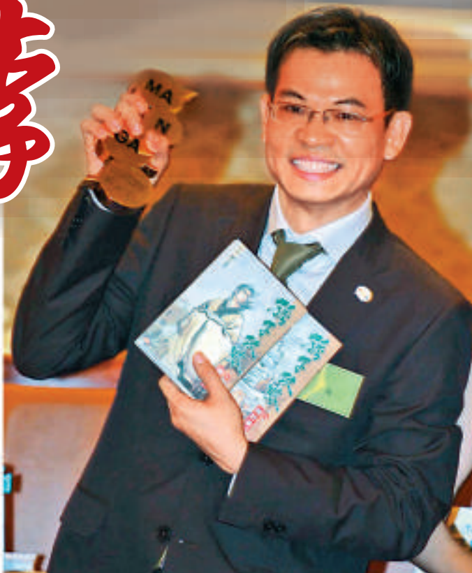
李志清於2007年奪得日本首屆「國際漫畫賞」最高榮譽之「最優秀作品獎」

解，李志清笑說，「常常是偶然的一筆，我立於偶然，讓筆端繼續發展下去，偶然有偶然的美。」他懂得「偶然」的意境，這偶然又並非全然的巧合，來自他對於人物情節的反覆揣摩和探索，更來自於他30年堅實的功底和不斷上升的靈感。