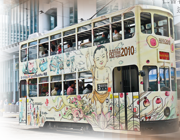
電車上的李志清畫作