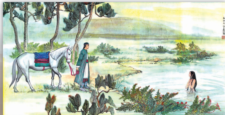
《書劍恩仇錄》中的陳家洛初遇香公主