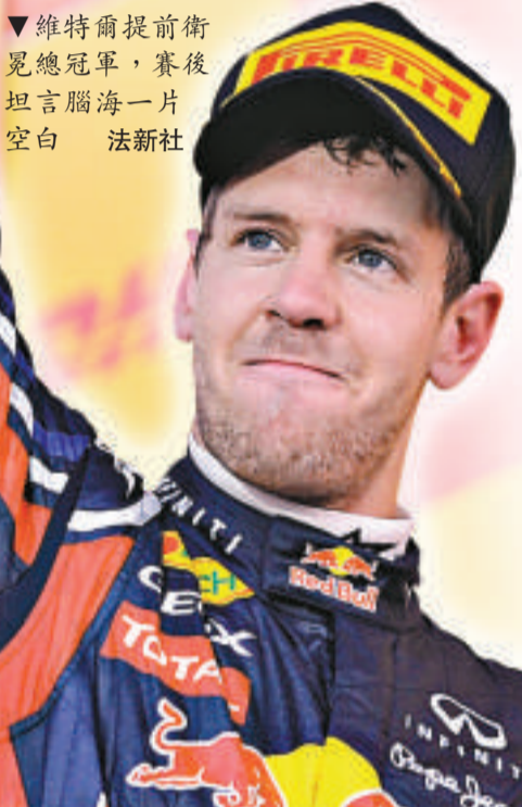
維特爾提前衛冕總冠軍，賽後坦言腦海一片空白