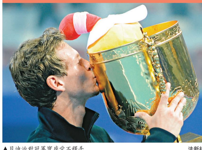
▲貝迪治對冠軍寶座愛不釋手