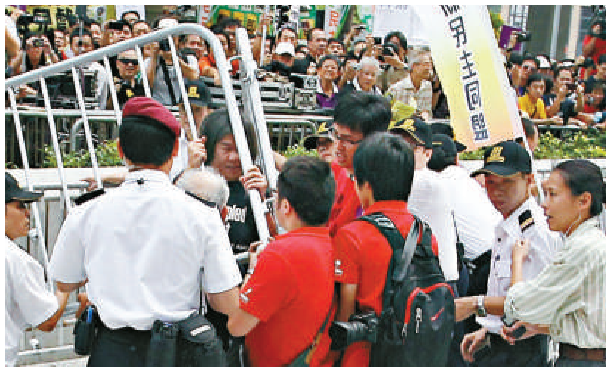
▲反對派立法會議員梁國雄企圖推倒鐵馬，與保安人員角力

擾攘約半小時後，遊行人士開始推撞警方和保安，跨越保安設下的雙重鐵馬防線，強行闖入總部外的停車場空地聚集。早前被控擾亂公眾秩序及刑事毀壞的反對派議員梁國雄亦推撞鐵欄，與保安人員角力。保安眼見防線已被示威者衝破，只好開放另一邊讓遊行人士前進。