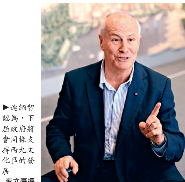
▶連納智認為，下屆政府將會同樣支持西九文化區的發展

被問及對西九管理局主席的期望，連納智說，主席代表政府支持西九項目進行。他讚揚唐英年過往為西九文化區的努力，「He's done a very good job」(他做得很好!)，感謝唐給予他機會帶領西九文化區，並希望在林瑞麟帶領下，西九發展項目如期落成。他沒有評論唐英年考慮參選特首之事，他認為下屆政府同樣會十分支持西九的工作。