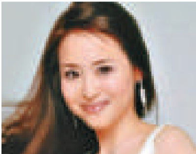
▲有傳聖子拍劇獲厚待，令恭子大為不滿

雜誌《周刊實話》透露，今年由上野樹里主演的大河劇《江》，收視不濟，原因是流失了一群中年觀眾。NHK電視台為保《平》的收視，千方百計找來不少中年歌迷的松田聖子參演。聖子在劇中扮演一名歌姬，除了是重要的角色外，劇情更安排她獻唱歌曲，變成她的「個人舞台」。NHK更要其他演員讓聖子的檔期，引起其他女演員的不滿，尤其是貴為第一女主角的恭子。再者，綾瀨遙將主演後年的大河劇《八重之櫻》，視她為勁敵的恭子早已