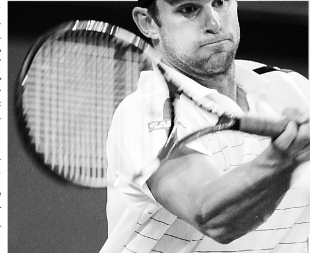
▶羅迪克苦戰三盤後，淘汰盧彥勳晉級