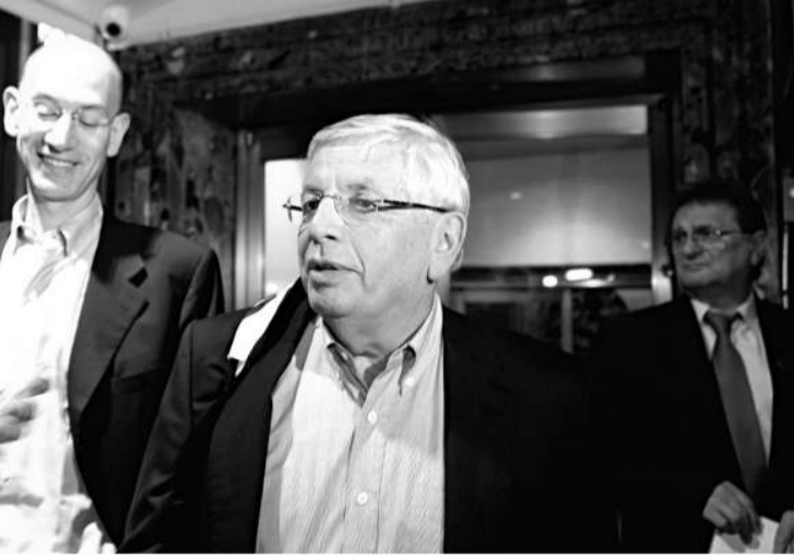
▲ NBA總裁斯特恩(左二)並沒有就談判結果作出過多的回應