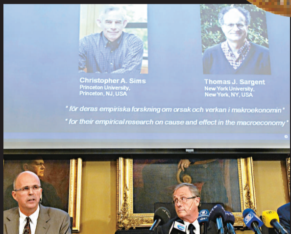
Christopher A. Sims Princeton University Princeton, NJ, USA Thomas J. Sargent New York University New York, NY, USA

「for deras empiriska forskning om orsak och verkan i makroekonomin」 「for their empirical research on cause and effect in the macroeconomy」