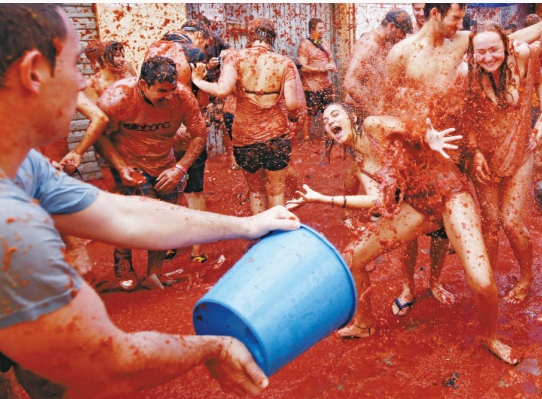
◀▶遊人忘我地互相狂擲番茄和潑番茄漿，場面熱鬧