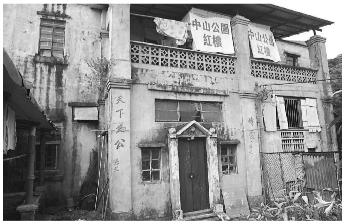
屯門青山農場舊址內的紅樓

按內地添加劑使用衛生標準規定，胭脂紅可嚴格限量用於果汁飲料、配製酒、糖果、冰淇淋等食品的着色，而不能用於紅腸腸衣和肉製品。由此標準，上述豆瓣醬以及我們在外場上見的紅蝦米、肉脯、叉燒、玫瑰茶花等添加人工色素胭脂紅即是非法的。