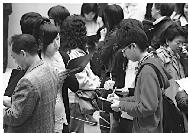
▲政府計劃讓副學士也有機會出外交流

梁紀昌總結，教育政策需要長遠規劃。特首提出香港將轉型為「知識經濟型社會」，既然現行大學學額不足問題，與其發展副學士，為何不直接增加學額，給更多青年人入大學機會？