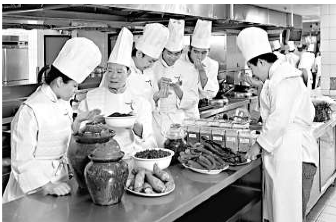
▲政府計劃斥資五億設「國際廚藝學院」，教授各國菜餚廚藝、品酒及配搭酒類方法，與中華廚藝學院相輔相成