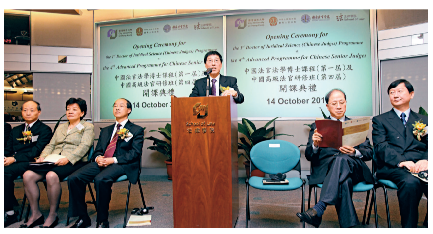
▲城大法律學院與中國國家法官學院合辦全國首個「中國法官法學博士」課程，為現任內地現職高級法官提供高質素之博士學位教育，中為城大校長郭位

除「中國法官法學博士」課程外，第四批「中國高級法官研修班」亦已開班，開展為期十五日的學習交流，為內地高級法官提供中外法制溝通交流平台。