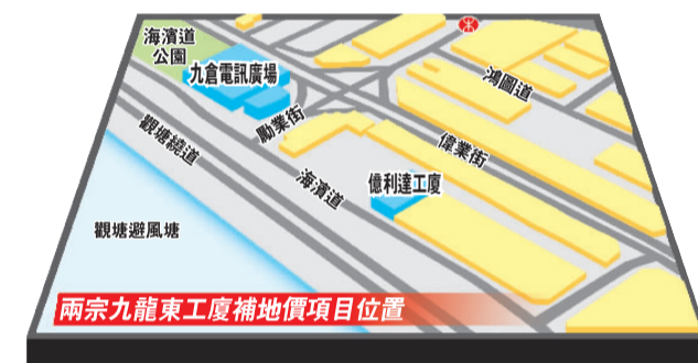
▲兩宗九龍東工廈補地價項目位置