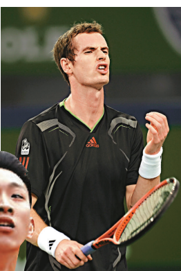
▲梅利輕取艾比丹殺入4強