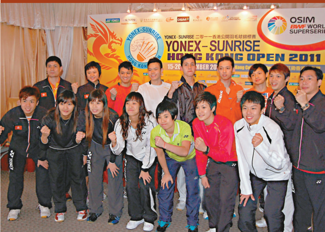
▲港隊成員在賽前為自己加油打氣

【本報訊】2011香港公開羽毛球錦標賽將於下月15日起首度移師香港紅磡體育館舉行，共吸引28個國家和地區252名世界級好手參加，其中包括中國的「全滿貫」球手林丹，男單世界「一哥」、馬來西亞的李宗偉，女單世界排名頭三位的中國羽球手王儀涵、王適嫻、汪鑫。其他參賽好手還包括中國的「風雲組合」蔡贇和傅海峰、韓國男雙組合李龍大和鄭在成。