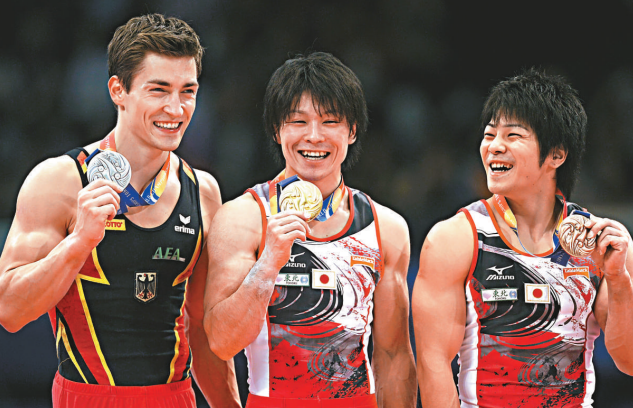
▲內村航平(中)完成世錦賽三連冠，左為亞軍的鮑伊，右為季军山室光史

■綜合外電韓國十四日消息：世界一級方程式賽車(F1)本週移師韓國舉行，麥拿拿車隊的英國車手咸美頓在周五的首兩次練習賽做出1分50秒828的最快圈速，暫高踞排位榜之首，其隊友兼同胞巴頓則以零點一零四之差緊隨其後，已提前贏得車手總冠軍的紅牛德國車手維特爾則以1分52秒646排在第三位。