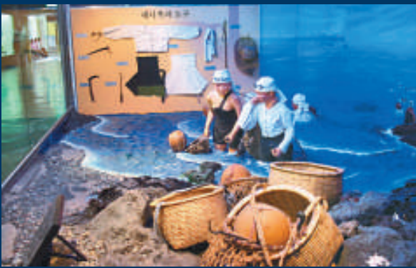
▲韓國海女博物館中穿着傳統服裝的海女雕塑

來到韓國濟州島，你經常會在海邊看到她們：黝黑的皮膚，長髮盤在頭頂，身穿黑色的緊身潛水衣，背着色彩鮮艷的背囊，一個猛子扎進海裡。她們就是著名的濟州島海女，也是這一帶村