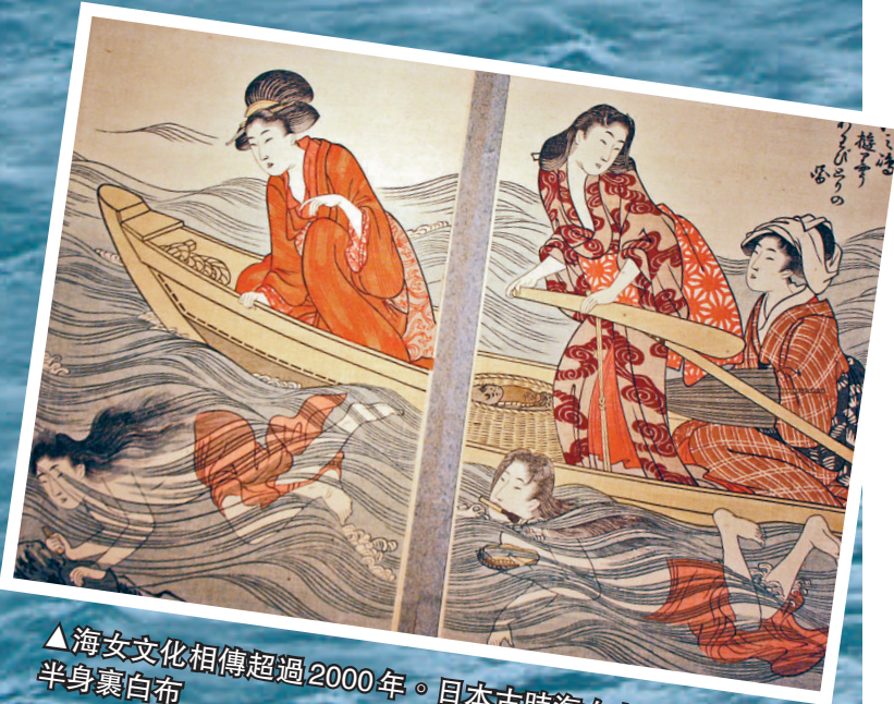
▲海女文化相傳超過2000年。日本古時海女上半身裸體，下半身裹白布

他說，想將海女的文化登記為世界無形文化遺產，本月底將召開「海女高峰會」，讓日本列島海女大集合，屆時韓國濟州島的海女也會參加。但受到3月11日大地震重創的日本東北的海女不克參加。