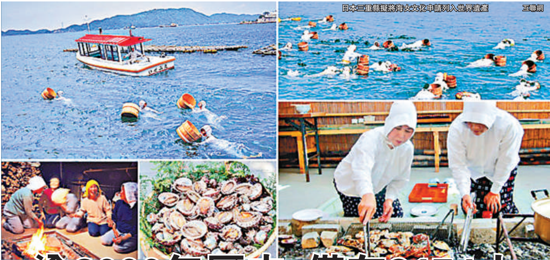
日本三重縣擬將海女文化申請列入世界遺產