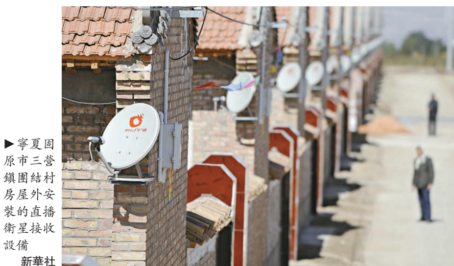
►寧夏固原市三營鎮團結村房屋外安裝的直播衛星接收設備

據珠海市人力資源社會保障局局長李偉輝介紹，現場展示的40個留學人員創業項目集中在信息技術、新能源新材料節能環保及生物醫藥等新興產業領域，其中生物醫藥類項目10個，互聯網信息技術類項目14個，新能源新材料14個，農業和教育培訓類項目2個。