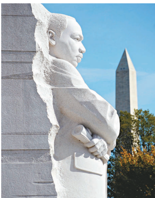
▲中國雕塑家雷宜鈺製作的馬丁·路德·金紀念碑

【本報訊】美國總統奧巴馬16日親自為中國雕塑家雷宜鈺製作的馬丁·路德·金紀念碑揭幕，並發表講話呼籲國人「團結」，繼續馬丁·路德·金心目中的夢想。他還有感而發，希望國人繼續挑戰華爾街的過分做法，但不要妖魔化那裡所有的工作人員。據悉，現場有美國政要、歌星、影星及美國社會各界人士近5萬人參加。