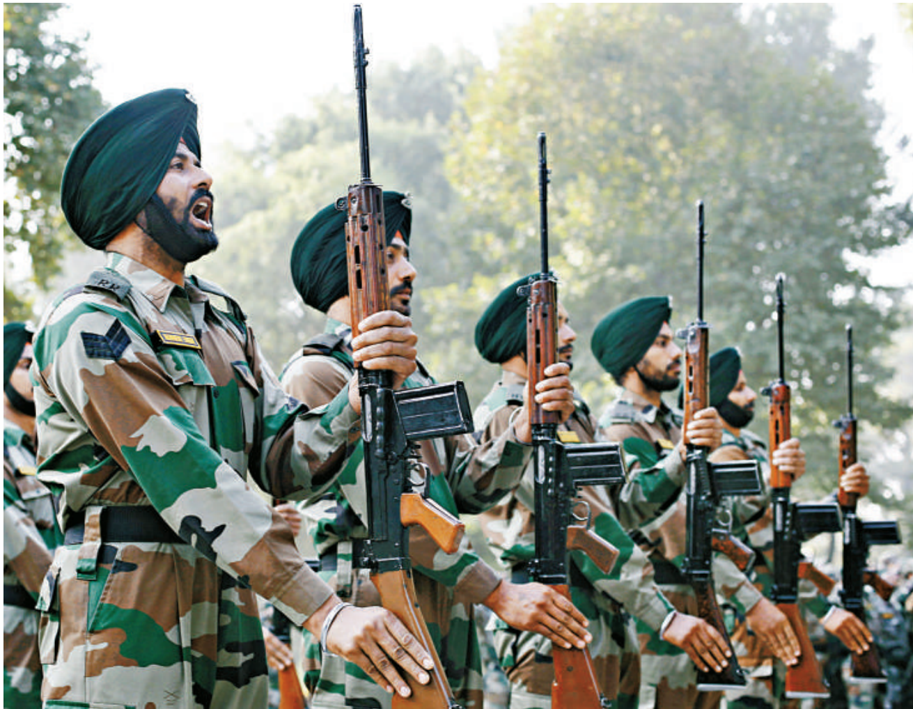
▲印度總理辛格已同意新增89000名士兵的擴軍計劃

據該報透露，越南屬於公司領導層確定的大約「15個友好國家」之一，可以向這些國家出售該類型的巡航導彈。該報引述消息人士的話稱：「（向越南出口導彈）的非正式談判已經開始。」印度至今為止還從未向第三國出口過這種巡航導彈。