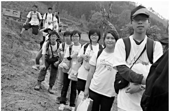
▲▼文理書院（香港）十八年來積極舉辦各項考察活動，安排到廣西山區探訪，讓學生親手耕種、砍柴和餵養，真正地讓學生深入了解中國文化及國情

認為是次旅程可了解中國貧窮地區的發展，「親身感受農村的活動，了解經濟較差地區情況，對認識祖國有幫助」。