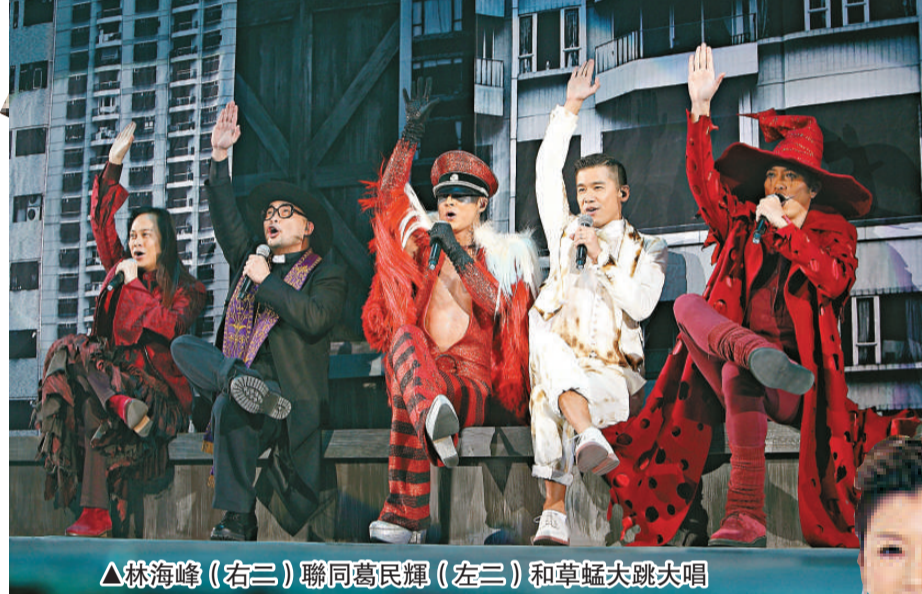
▲ 林海峰（右三）聯同葛民輝（左三）和草蜢大跳次唱