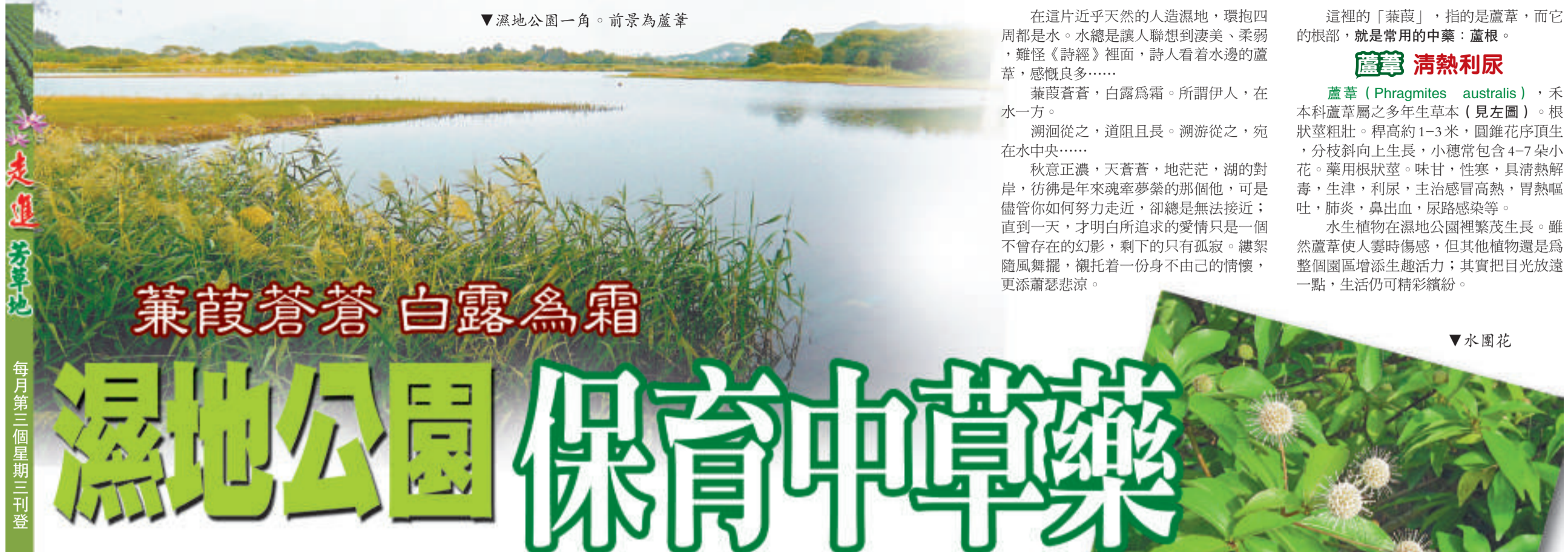
▼濕地公園一角。前景為蘆葦