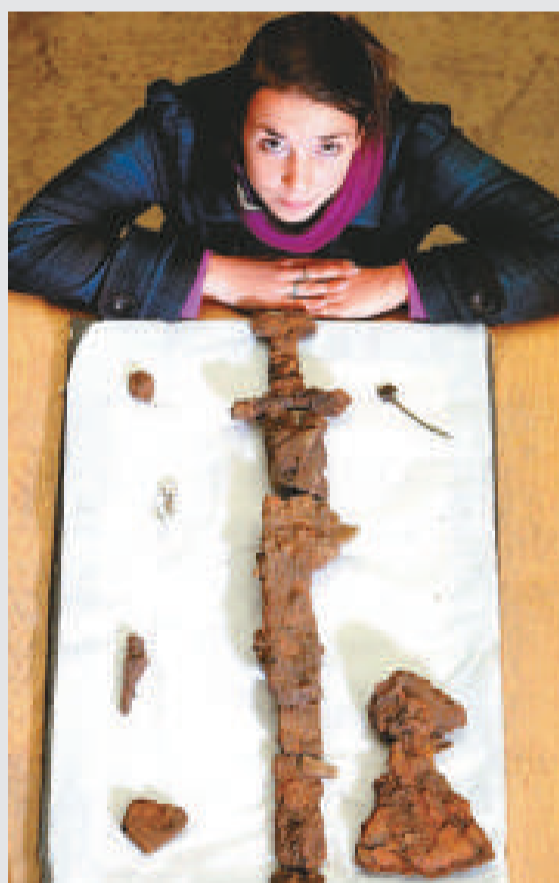
▲維京海盜大王墓中的劍