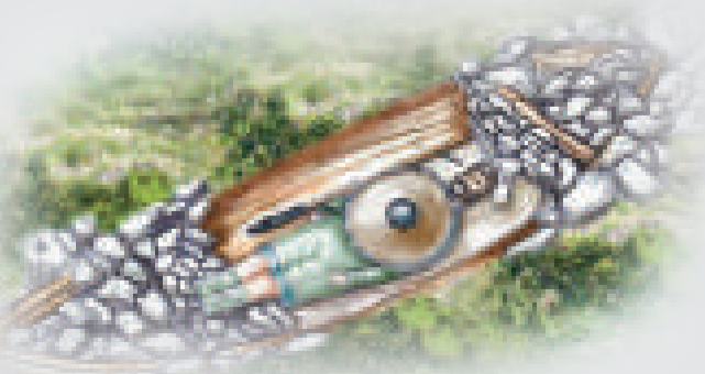
▲維京海盜大王之墓的素描圖