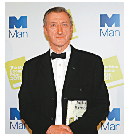
▲英國作家巴恩斯和他的小說《終結感》