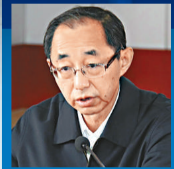
朱佳木 中國社會科學院副院長兼當代中國研究所所長、國史學會常務副會長

一項項改革使重慶文化產業進入黃金發展期，宣傳文化基金會、文化產業融資擔保公司先後設立，全市每年編列專項資金，對微型文化企業按企業資本金的30%至50%的比例給予補助，並幫助融資貸款，給予稅收優惠。文化產業發展生態不斷優化，國有文化集團集約化、規模化經營水平得到提升，民營文化企業發展活躍，以公有制為主體、多種所有制共同發展的文化產業格局已經形成。