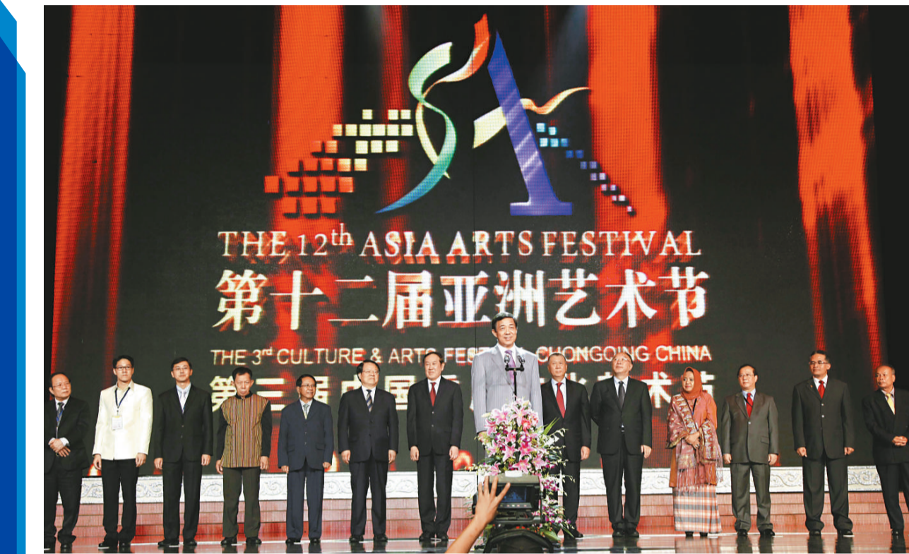
▲第12屆亞洲藝術節日前在重慶開幕