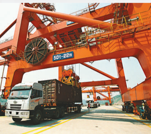
▲重慶兩路寸灘保税港區水港功能區

民群眾的領導力。國家副主席習近平來渝視察後指出：「重慶實行聯繫服務群眾「三項制度」，做好新形势工作中工作，效果明顯，要好好總結。」