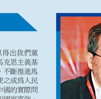
張全景 中組部原部長、全國黨建研究會原會長

重慶要在建設改革開放高地的同時，建設道德文化高地，這是中國共產黨發出的時代強音，也是建設中國特色社會主義的又一偉大實踐。