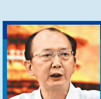
虞川耀 全國人大常委、全國黨建研究會會長

回顧中國共產黨90年歷程，可以得出我們黨在推進理論創新的基本經驗：善於把馬克思主義基本原理同中國國情和時代特徵相結合，不斷推進馬克思主義中國化、時代化、大眾化，使之成為人民群眾喜聞樂見的思想武器；善於解決中國的實際問題，服務於完成民族獨立、人民解放和國家富強、人民共同富裕的歷史任務；善於堅持黨的思想路線，大力倡導解放思想、實事求是、與時俱進、求真務實精神。