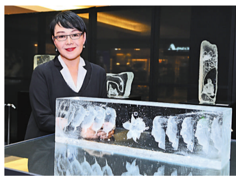
楊惠珊與她的琉璃作品

楊惠珊是上世紀七十年代台灣演員，曾獲得兩屆台灣金馬獎最佳女主角和亞太影展最佳女主角。一九八七年，她投身現代琉璃藝術，創立琉璃工房。二十年來，她以她獨特的藝術天分和敏銳的觀察力，創作出富含中國傳統風格與人文思想的雕塑作品。她的作品被多家博物館收藏，其中有中國北京故宮博物院、敦煌研究院、英國維多利亞與亞伯特博物館、美國康寧玻璃博物館等。去年她的作品