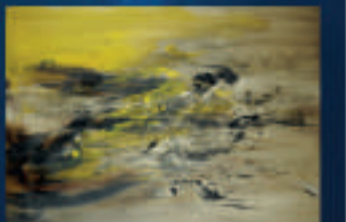
「22.07.64」為中國一代油畫大師趙無極的作品。