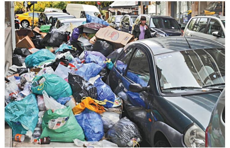
▲希臘市政局工人連日來發動罷工，雅典市中心的垃圾無人處理

去年5月，歐盟與IMF決定向希臘提供1100億歐元的援助貸款，避免當地政府債務違約。歐元區財長10月21日會議結束之後透露，目前正在着手制訂拯救希臘的第二份方案，但未介紹相關內容。