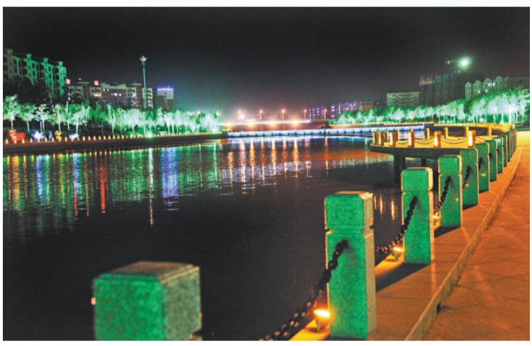
▲改造後的五里河——龍港段