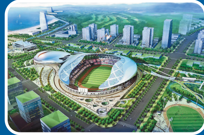
▲葫蘆島中央商務區效果圖

葫蘆島，諧音就是福祿島，是一座新興的沿海工業城市，是一座著名的旅遊文化名城，這裡有山有海又有灘，有城有島又有溫泉，她山川秀美，海濱宜人，景色綺麗，被喻為「渤海明珠」。 葫蘆島，僅從這個名字來說，就充滿神秘感。她確實跟葫蘆有關，葫蘆島是一個深入海中的半島，從空中俯瞰，地形酷似葫蘆，並因此而得名。葫蘆在中國文化史上是一個非常吉利的名字，代表福、祿、壽、喜、財，很吉祥。 葫蘆島地理位置優越，地處遼寧省西南部，自然風光綺麗多姿，歷史文化源遠流長，民俗風情異彩紛呈。她西與秦皇島毗鄰，距離京津唐等華北城市群不到400公裡；向北經306國道，可達內蒙古腹地；向東與瀋陽、大連、長春、哈爾濱等東北大城市遙相呼應；向南出渤海，可與煙台、青島等城市相通。葫蘆島可謂通渠之地。