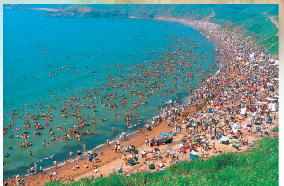
▲美麗的葫蘆島海濱

這不是一句漂亮的口號，而是實實在在的行動。葫蘆島振興崛起恰逢其時。這裡有巨大的開發潛力，就工業發展而言，圍繞石化、有色金屬、船舶、機械等優勢主導產業，尚有可以百億元計算的原材料和初級產品深加工潛力；就沿海開發而言，完全有條件建設噸深水大港，沿海一帶還有豐富的鹽鹼灘地和工業預留地，發展鹽鹼工業、港口物流業和離岸服務業的條件十分優越；這裡生態環境、旅遊資源優勢得天獨厚，發展綠色產業前景廣闊。