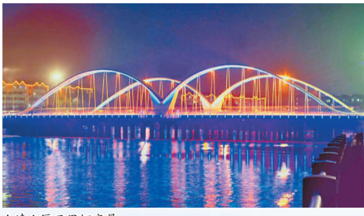
▲遼山區五里河夜景