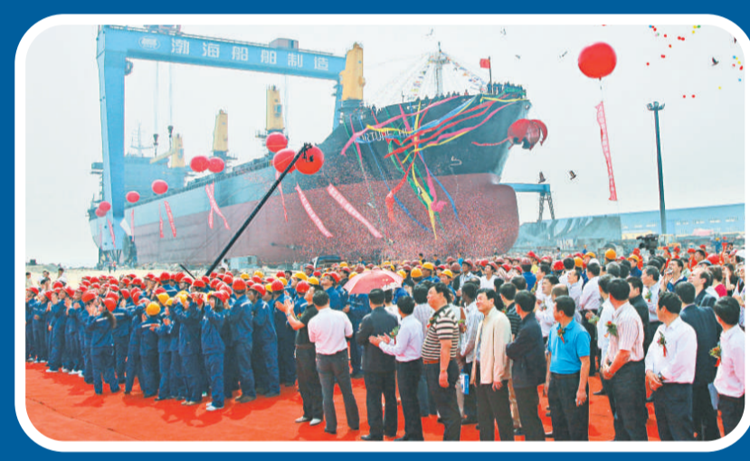
▲葫蘆島渤海船舶製造有限公司是葫蘆島經濟開發區引進的重點招商引資的民營企業，圖為5月25日，首艘3.48萬噸散裝貨船「富貴英豪」輪下水命名儀式