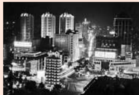
▲美麗星城長沙夜景