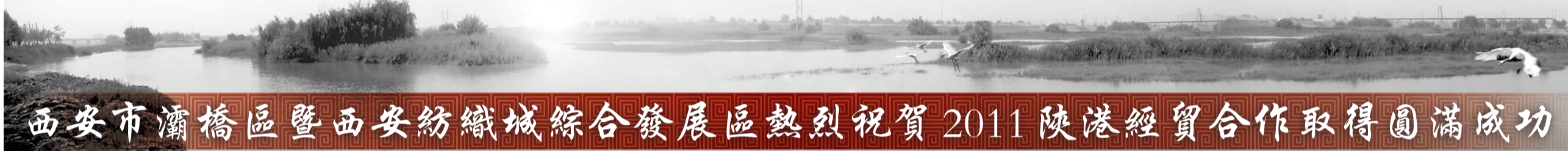
西安市灞橋區暨西安紡織城綜合發展區熱烈祝賀2011陝港經貿合作取得圓滿成功