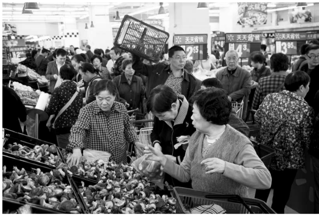
▲在經歷了假冒「綠色豬肉」風波後，沃爾瑪在重慶的十三家門店二十五日重新開業。圖為顧客在南坪分店選購食品

今天上午9時，沃爾瑪在重慶的13家店面經過15天停業處罰整頓之後，再度開張營業。在「巨大」優惠下，旗下各家超市入口人來人往，超市裡面人頭攢動。重慶市民以旺盛的人氣，「寬容」了改錯後的沃爾瑪。但採訪中有顧客表示，仍很憂慮食品安全會否「捲土重來」。