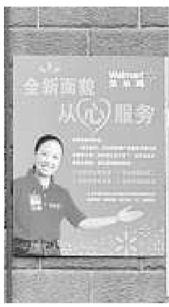
◀「全新面貌 從『心』服務」，重慶一家沃爾瑪分店在門口張貼上這樣的海報以表決心