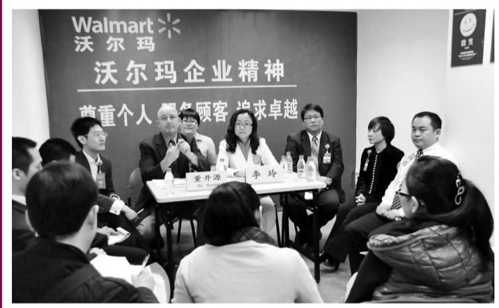
▲二十五日，沃爾瑪重慶松青路分店舉行媒體見面會

在見面會上，當記者轉遞着中國消費者，特別是70後、80後為代表的消費者群體聲音漸強的質疑時，沃爾瑪的先生們僅從豬肉的分割流程處理，從所謂「沃爾瑪文化」在華建設，從內部、基層聲音的傾聽上作解釋。然而，面對記者的質疑，沃爾瑪相關人士則反覆談及「我們已進行了3萬餘小時培訓」，「我們將從中學到很多東西」等，沒有正面回答記者對食安的擔憂和追責情況質疑。