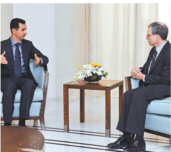
▲今年1月，敘利亞總統阿薩德（左）與美國大使福特（右）會面 資料圖片