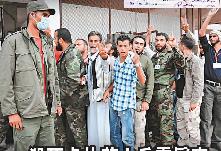
▼10月24日，在利比亞米蘇拉塔，人們排隊參觀卡扎菲和其兒子穆塔西姆以及前國防部長賈卜爾的屍體