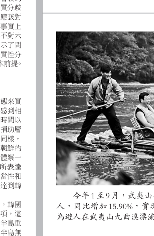
今年1至9月，武夷山共接待遊客560.11萬人，其中境外遊客13.45萬人，同比增加15.90%，實現遊客總收入93.79億元，同比增加17.75%。圖為遊人在武夷山九曲溪漂流。

《基本法》規定「禁止香港特別行政區的政治性組織或團體與外國的政治性組織或團體建立聯繫」。雖然本港尚未就此自行立法，暫沒有相關刑律對違法者刑拘，但此憲制性法規，卻是體現中國人民數千年來延續至今的反對出賣國家民族利益、愛國家愛民族的崇高政治倫理。這一政治倫理，深植於中華民族世代子孫心中，同時也為世界各國、各