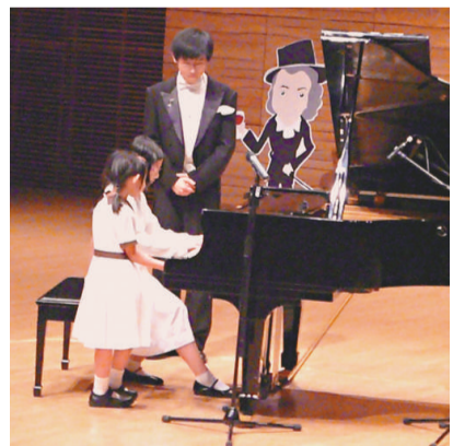
▲兩名小女孩主動舉手上台演奏

【本報訊】記者楚長城開封報導：中國開封第二十九屆菊花會暨第三屆中國收藏文化（開封）論壇日前在河南開幕，系列活動相繼展開。