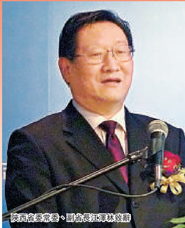
陝西省委常委、副省長江澤林致辭

「2011年陝港澳經濟合作活動」正在本港如火如荼進行。本次系列活動的重頭戲之一「西安投資環境說明會暨西安曲江新區重大專案簽約儀式」昨日下午在港島香格里拉大酒店舉行。西安市此次共推出88個項目，主要涉及文化旅遊、高新技術、節能環保等戰略性新興產業以及先進製造業和商貿物流業等重點領域。西安曲江新區簽約21個項目，投資總額達230億（人民幣，下同）（約281億港元）