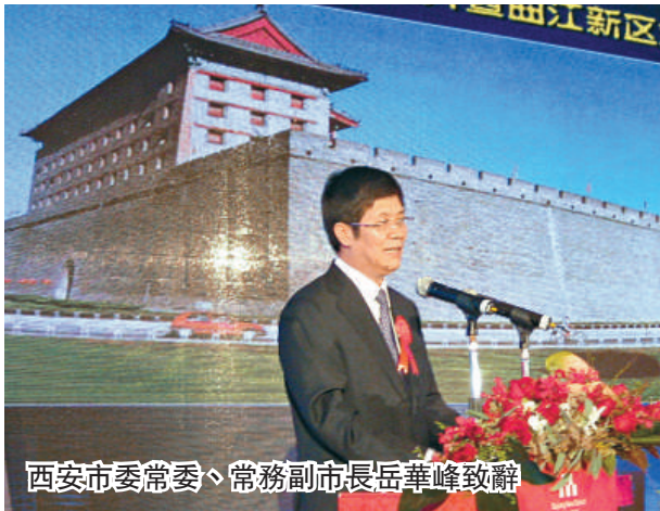
西安市委常委、常務副市長岳華峰致辭