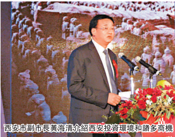
西安市副市長黃海清介紹西安投資環境和諸多商機

中央人民政府駐香港聯絡辦公室副主任殷曉靜，陝西省委常委、副省長江澤林，西安市委常委、常務副市長岳華峰，西安市副市長黃海清以及新加坡悅榕集團、馬來西亞成功集團、金輝投資（香港）公司、香港運高集團、香港美亞娛樂資訊集團、香港和記黃埔集團、招商局中國基金、新世界集團、鳳凰衛視、摩根士丹利、摩根大通、北京能通科技股份、人人網、歐擎投資集團、開元城市發展（西安）基金等企業界、金融界高層共200餘人出席了本場活動。