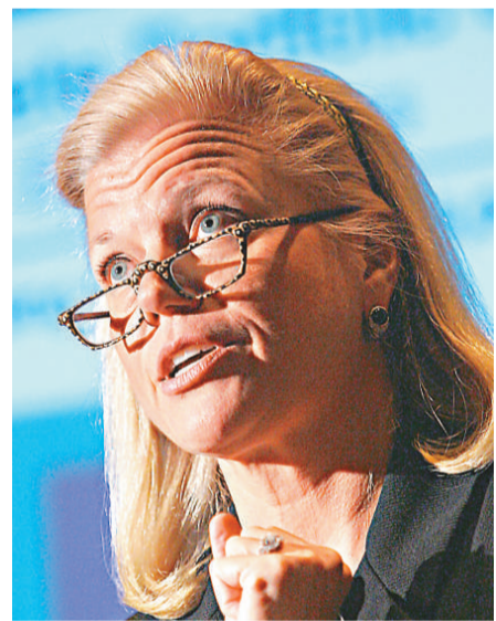
▲IBM資深副總裁羅梅蒂將於明年升任行政總裁

羅梅蒂出身芝加哥，1979年在西北大學拿到學位，後來進通用汽車實習，然後進IBM。