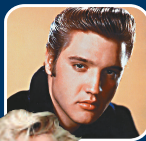
▲米高積遜死後的賺錢能力比起生前毫不遜色 資料圖片