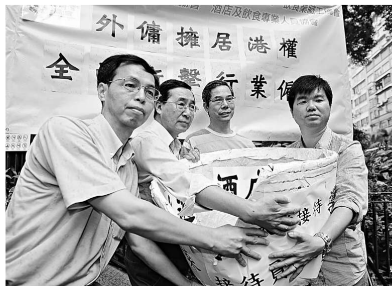
多個服務業工會反對外傭享有居港權