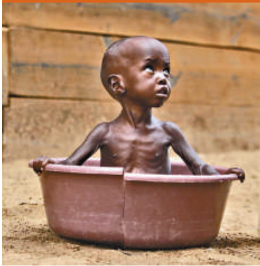
▲ 氣候變化將令非洲的旱情加劇

【本報訊】據《聯合早報》27 日報道：一項研究顯示，氣候變化影響全球三分之一的人口，而這些人主要生活在亞洲和非洲。氣候變化對歐洲北部的富裕國家的影響最小。