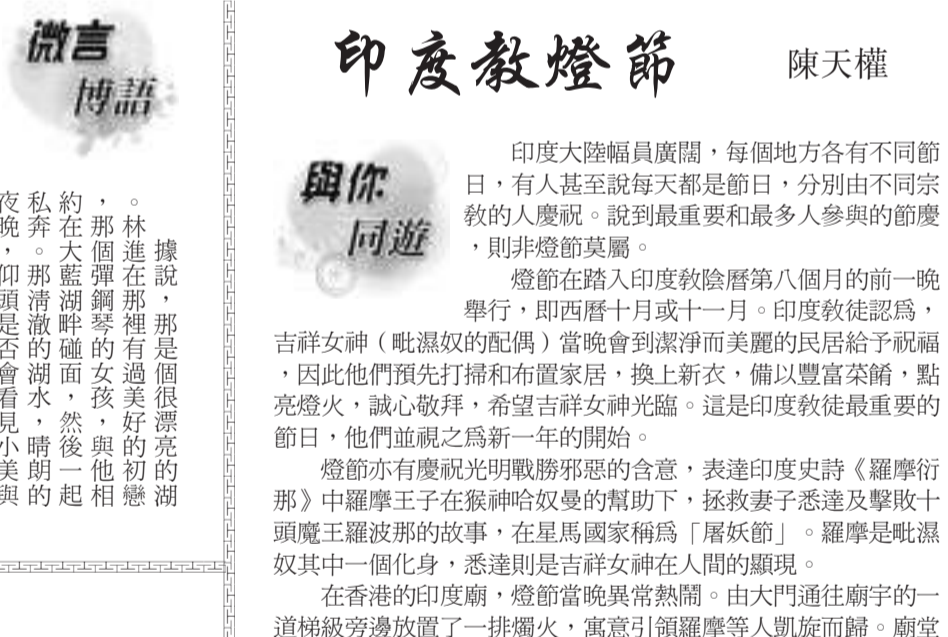
香港的印度教徒在印度廟內慶祝燈節