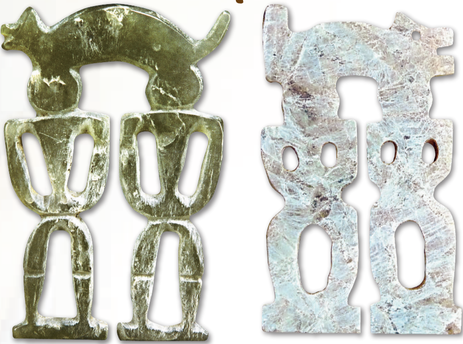
▲左為台灣卑南文化，雙人頂虎玉玦；右為三星堆文化，雙人頂虎玉玦

了極度輝煌的文明。考古挖掘的兩坑青銅器，僅僅掀開三星堆文明的一角，就足以讓世人驚嘆得不敢相信！盛行祭祀，玉器和青銅製作等技術發達程度領先黃河中原地區500多年的古蜀人，在兩千年的時間裡還有多少驚世之作，實在是我們無法以常理來推測的。神秘莫測的三星堆，再次讓世人意外的證據就這樣被發現了。