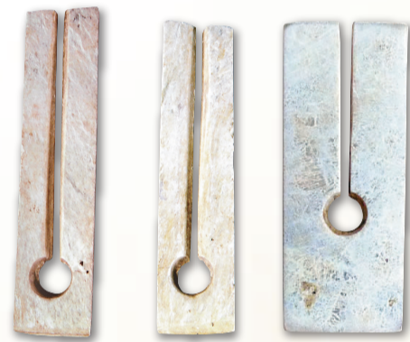
▲台灣卑南文化，長方形玉玦（左一及二）；右為三星堆文化，長方形玉玦

一般來說，當兩種不同的文化區出現相似的文化元素，通常存在三種可能：其一，在進化歷程中，人類文化有共同心理因素，有共同發展規律，因而不同的地區有可能會不約而同的創造出類似的文化元素。舉例來說，世界各地普遍存在的史前青銅文明就是如此，並非由一個源頭作為青銅冶煉製造技