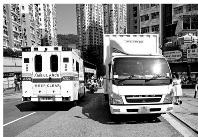
▲在荃灣被貨車撞傷的中五生由救護車送院

【本報訊】一名中七女生昨晨上學途中，在尖沙咀柯士甸道學校附近被電單車撞倒，飛拋數米外幸受輕傷，鐵騎士亦翻車擦損手腳，警方不排除意外涉及「衝燈」。