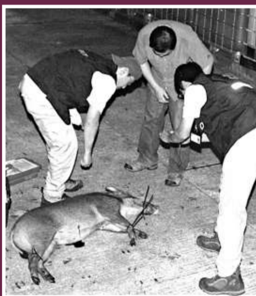
▲野豬中麻醉彈後倒地就擒

野豬被圍堵後驚慌，曾屢次作出困獸鬥，撞向鐵欄或發出嚇人怪叫聲，警員和漁護署人員，以巨型垃圾桶作屏障，同時手持盾牌戒備。由於野豬跑來跑去「冇時停」，漁護署人員欲發射麻醉槍未果；擾攘至傍晚六時四十五分左右，野豬力竭動作減慢，人員認為時機已至，遂向野豬發射麻醉槍打中肚腹，十多分鐘後藥力發作，牠癱倒在地，被漁護署人員輕易捉走。