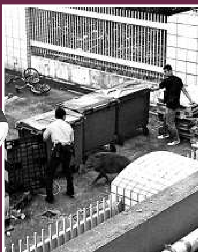
▲受困野豬反撲，撞傷警員腳部