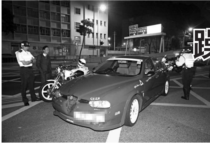
▲涉案跑車事後仍停在禁區內

此時，私家車突然開動行駛，警員冷不提防，疑被私家車倒後鏡撞及右腰，失平衡跌在地上受輕傷，立即向上峰報告。大隊警員趕到，將受傷同袍送院。涉案私家車司機需協助調查。司機事後聲稱，警員騎上電單車後，被自己身上裝備絆倒墮地，並高聲揚言若被檢控撞傷警員，將會不惜金錢打官司，與警方訴訟對簿公堂。警方暫把事件列交通意外處理，暫時未有人被捕。