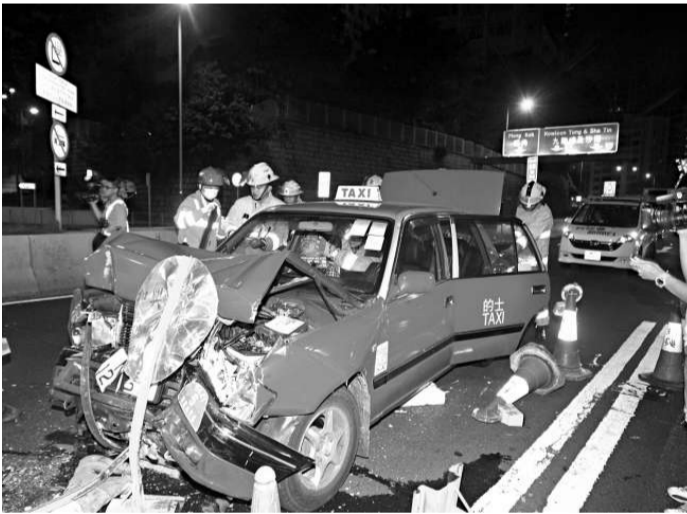
▶的士車頭毀爛不堪

受傷的士司機姓黎（四十九歲），事發昨日凌晨一時許，的士空載沿公主道往尖沙咀方向行駛，途至培正道交界，報稱閃避切線車輛失控，衝入中線一個修路地盤，撞毀一列雪糕筒及路牌後，狂撼停在中線箭咀工程車尾部的士車頭毀爛，司機胸部撞傷送院。箭咀工程車被撞至衝前數米，車尾損毀，司機幸無受傷。