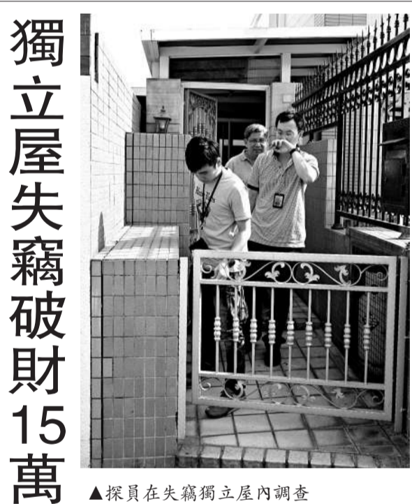
▲探員在失竊獨立屋內調查