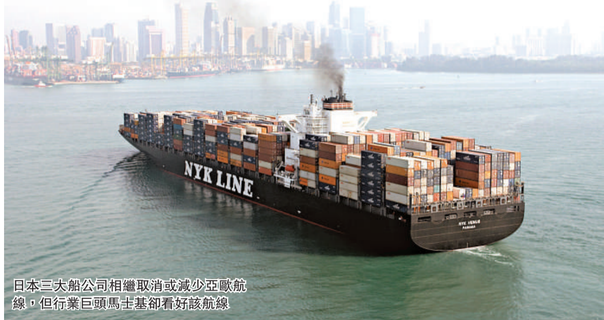
日本三大船公司相繼取消或減少亞歐航線，但行業巨頭馬士基卻看好該航線。

「日日馬士基」為亞歐航線向客戶提供了每日貨箱交付的截港時間，這意味着可更快捷的將貨品運送至目的地，降低減少了其儲存的時間。馬士基的聲明表示，該計劃實行6星期以來，99%的貨品能按時付運交貨，而行業的平均按時交貨率僅有50%。