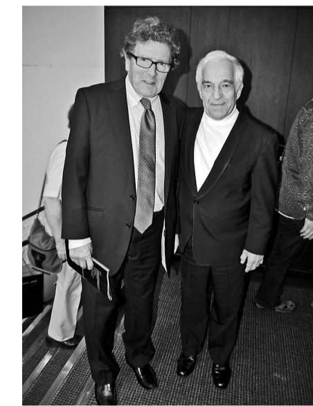
Ashkenazy (右)與作曲家 Howard Blake 在決賽前合影