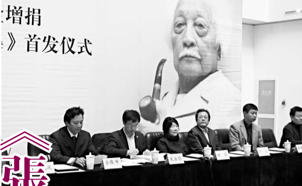
張竹勵學金增捐暨《張竹勵追思文集》首發儀式日前在京舉行