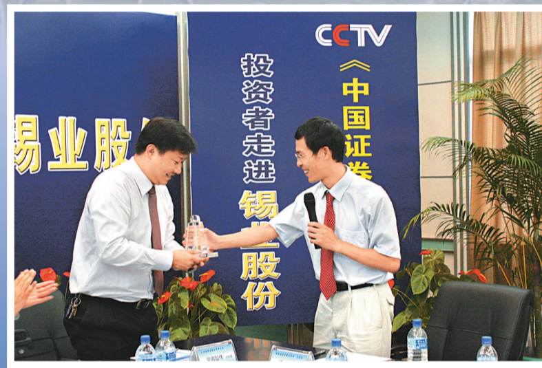
中央電視台走進錫業股份

懷着一顆崇敬的心，踏着無邊的秋色，我們走進雲錫，掀開了雲錫百年的發展史冊。 文：辛民 楊會國