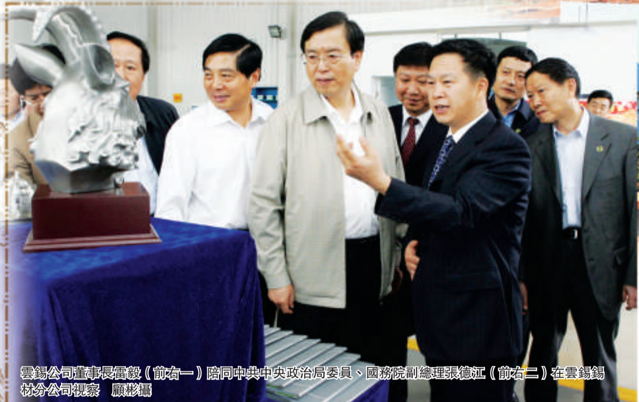
雲錫公司董事長雷毅(前左一)陪同中央中央政治局委員、國務院副總理張德江(前右二)在雲錫錫業分公司視察 顧秋鵬