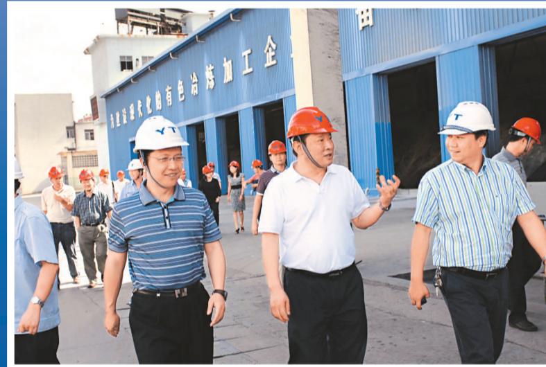
國家安全生產標準化示範企業創建工作檢查組到公司調研