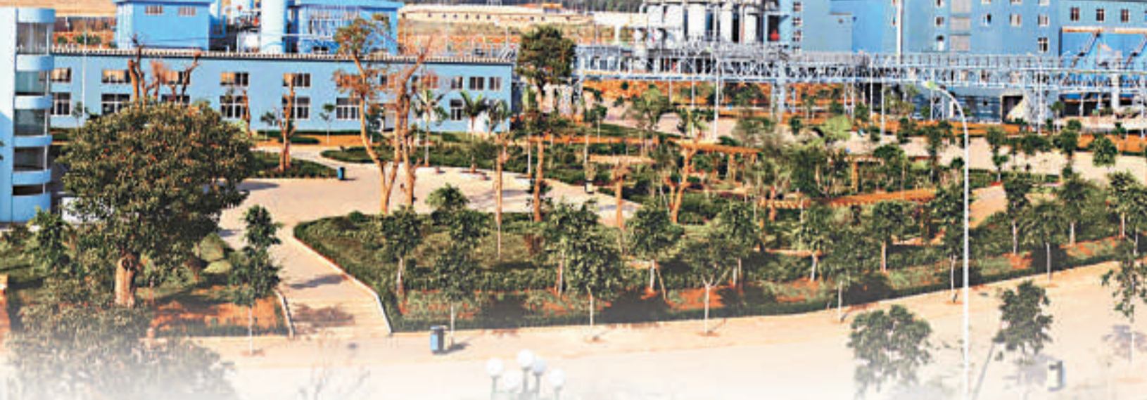
錫業股份配股暨投資價值推介會現場