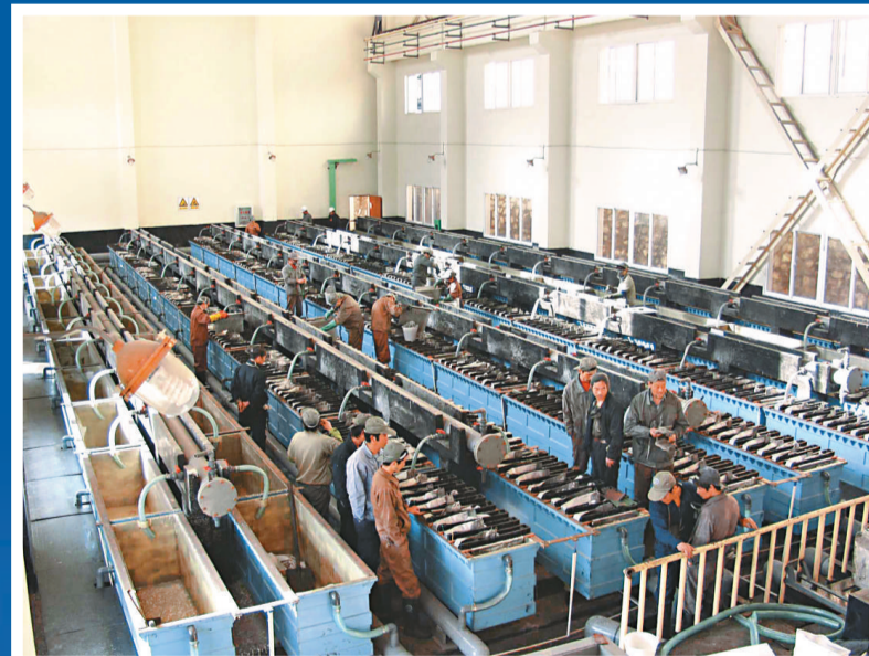
浴綫分公司電解車間新開機電解工序