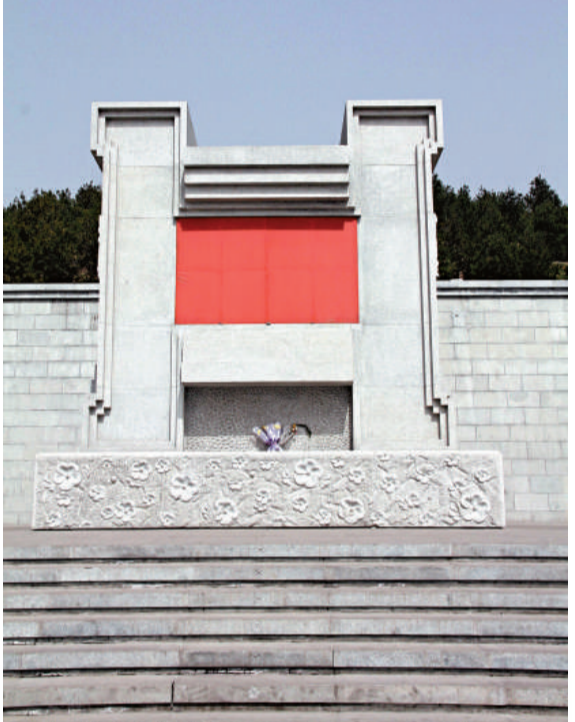
▲華國鋒骨灰就安放於這座墓碑後山體的墓室內