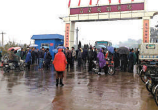
▲呂梁英雄廣場外的群眾冒雨等候