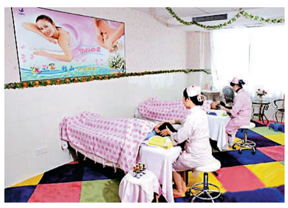
▲涉及醫療失誤的南海區紅十字會醫院。圖為該院提供產後按摩服務，促進產婦的產後身體恢復

據內地衛生部門相關專業人士指出，判定新生兒死亡的標準與判定一般人死亡無異，需要多項指標交叉判定，其中醫生需檢查患者心電圖、瞳孔、大動脈等相關情況，以確保判斷的準確性。但由於新生兒生命較為脆弱，更需要仔細呵護，醫生仔細診斷，反覆核查，避免錯診、漏診。該醫院相關負責人亦承認，當事醫生並未使用任何儀器檢測，只是根據經驗主觀判斷「孩子不行