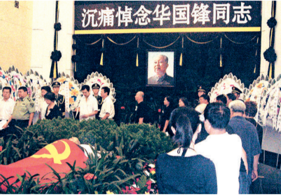
▲2008年8月31日，華國鋒遺體在北京八寶山革命公墓火化。圖為國家政要和北京各界人士向華國鋒遺體告別儀式 資料圖片

在八寶山革命公墓存放三年零兩個多月後，前中共中央領導人華國鋒的骨灰3日上午9時許在其出生和戰鬥過的故鄉——山西省交城縣卦山南麓呂梁英雄廣場上方的陵墓內安放。呂梁英雄廣場和華國鋒陵墓將封祭三天，周日（6日）後將向公眾開放。 【本報記者馬睿、楊清林，實習記者王賽蓉交城三日電】