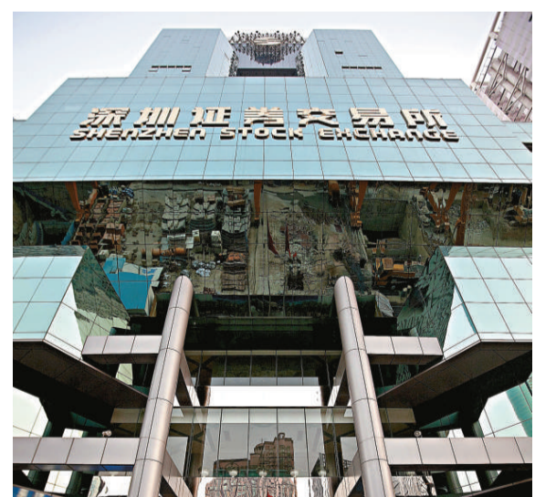
▲今年IPO(首次公開發行股票)審核通過率為76.9%

從融資規模看，今年以來已發行的公司共248家，募集資金2415.6億元(人民幣，下同)，平均每月IPO融資241.56億元。去年全年共347家發行，募集資金4911.3億元，平均每月IPO融資409.28億元。今年平均每月IPO的融資額約為去年的60%。儘管今年還剩下近兩個月時間，但從目前的發行節奏看，無論是發行家數還是募集資金總額都不大可能趕超去年。