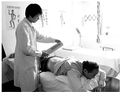
▲南京市最快將從本月起在全市各公立醫院推行第三方評價機制

【本報記者賀鵬飛南京四日電】為緩解日趨嚴重的醫患糾紛，提高醫療服務質量，南京市最快將從本月起在全市各公立醫院推行第三方評價機制，即聘請獨立第三方的專業調查機構對住院患者進行調查，調查結果將直接影響到醫院的薪資水平等。