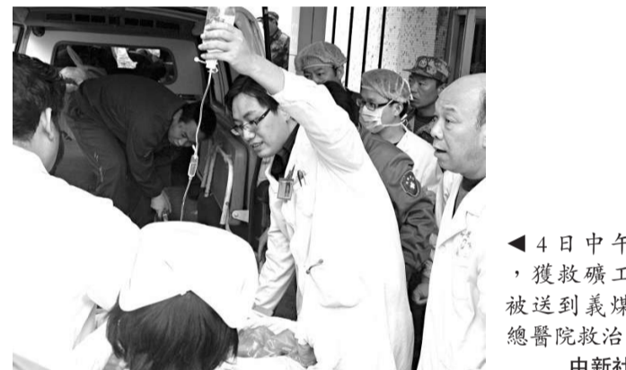
▲4日中午，獲救礦工被送到義煤總醫院救治