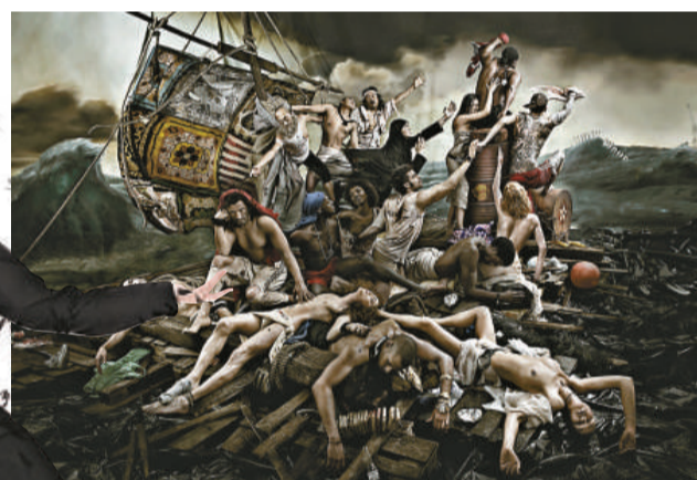
▲視覺想像作品《木筏的幻象》

該展覽將於十一月十一日至十二月一日在中環威靈頓街二號 Opera Gallery（香港）舉行。