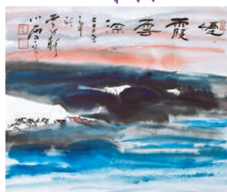
▲小雪畫作《煙霞雲深》以潑墨捕捉大自然的色彩變化