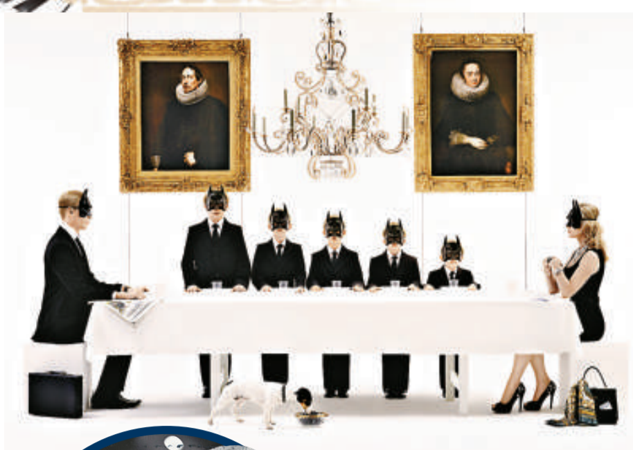
▲蘭斯南視覺想像作品《蝙蝠俠家族》