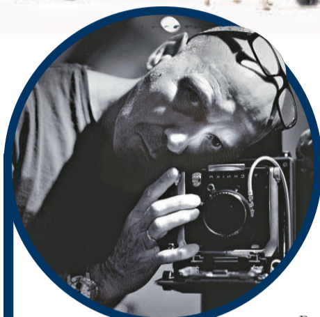
◀法國攝影家蘭斯南