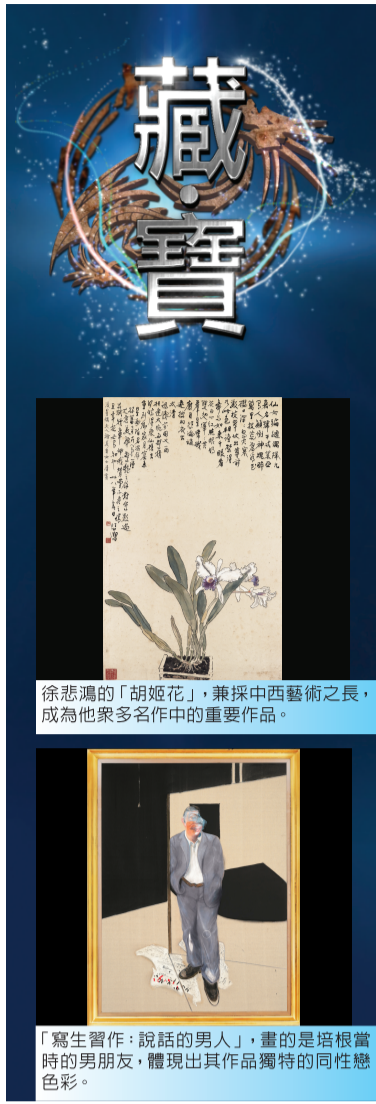
徐悲鴻的「胡姬花」，兼採中西藝術之長，成為他眾多名作中的重要作品。