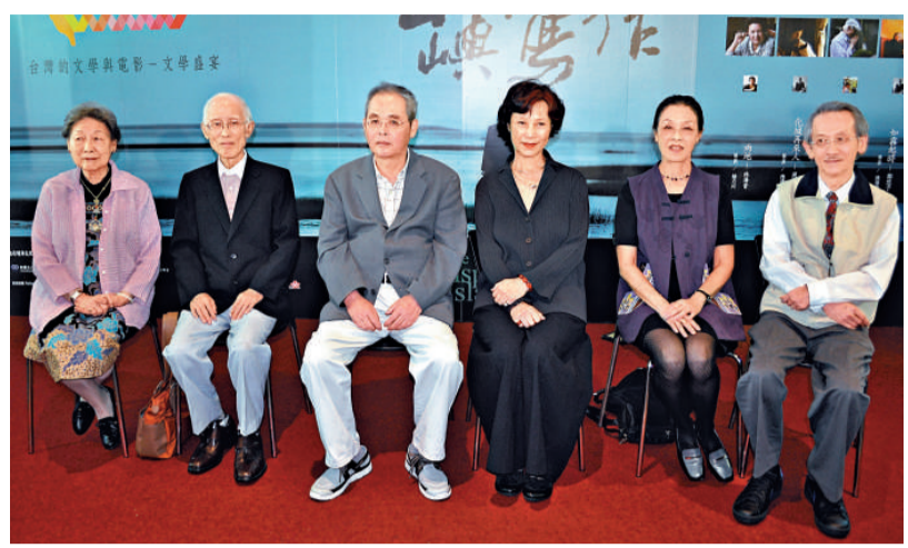
▲余光中(左二)、楊牧(左三)和王文興(右一)攜夫人在記者會後合影

台上的余光中，滿頭白髮，講話慢條斯理。他回憶在中大教書的經歷，回憶十一年旅居香港的生活，詞句中滿是對舊時人事的懷戀。寫了一輩子詩的余光中，從未想過有一天能當電影主角，選對導演「言聽計從」。