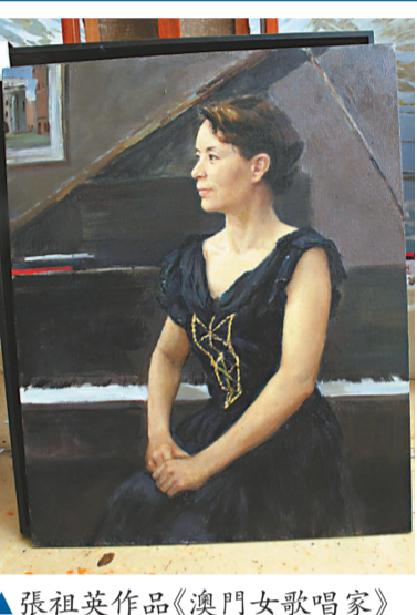
▲張祖英作品《澳門女歌唱家》

畫冊。個人傳記被編入英國劍橋國際名人傳記中心(IBC)及美國國際名人研究院(ABI)、國際當代有成就名人錄及國際名人傳記辭典等。是次展覽展期由十一月二十三日至十二月二日，每日上午十時至