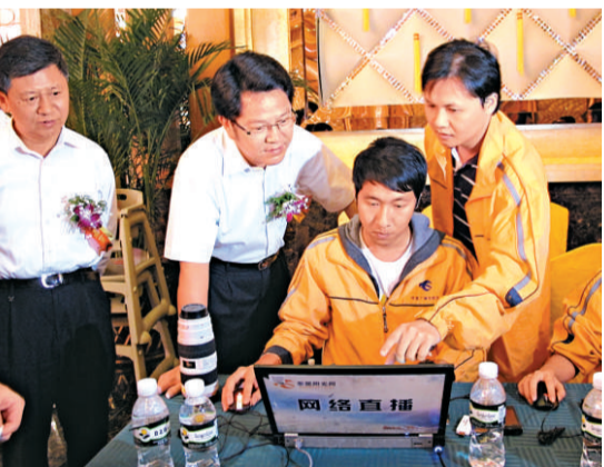
▲東莞市委書記劉志庚（左二）在記者節慰問前線新聞工作者 本報攝