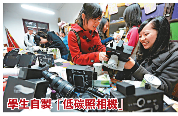
學生自製「低碳照相機」 江蘇揚州大學數科院的一些學生攝影記者7日用廢舊報紙和紙杯等材料自製「低碳照相機」，慶祝中國記者節的到來。 新華社

在劉志庚的大力推動下，媒體獲取信息的渠道更通暢，正面的信息和報道逐漸增多，通過客觀真實的宣傳報道，讓全省、全國乃至全世界了解一個真實的東莞、發展中的東莞，和雖不完善但每天都在改變的東莞，爲東莞加快調整結構，實現脫胎換骨營造良好的輿論氛圍。東莞也逐漸成爲人們印象中的「創造之城」、「活力之都」、「文化名城」，美譽度不斷提高。